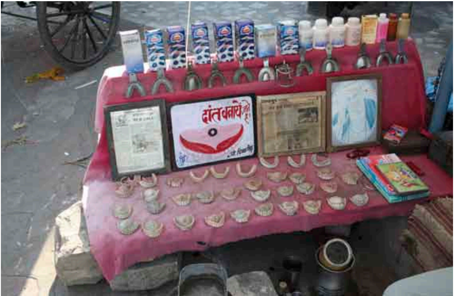
Puesto ambulante de un dentista en el bazar Kishanpol (Jaipur).