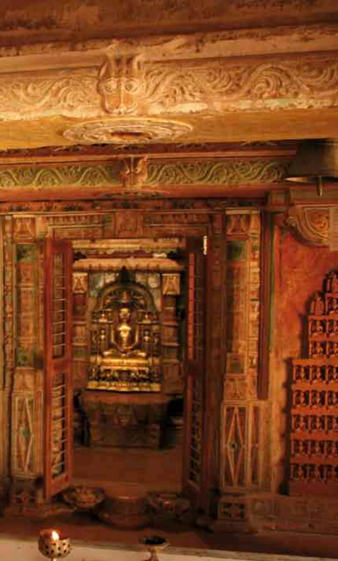
Rajasthan Monje jainí en el templo de Shitalnath (Jaisalmer).