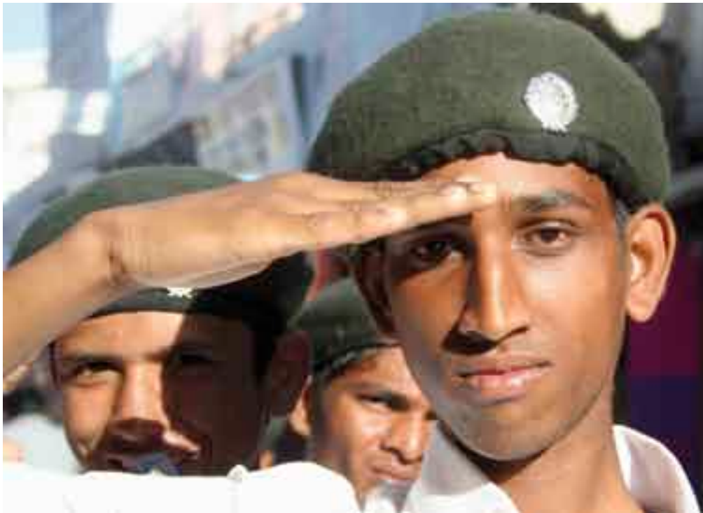
jóvenes de una escuela militar en el bazar de Pushkar