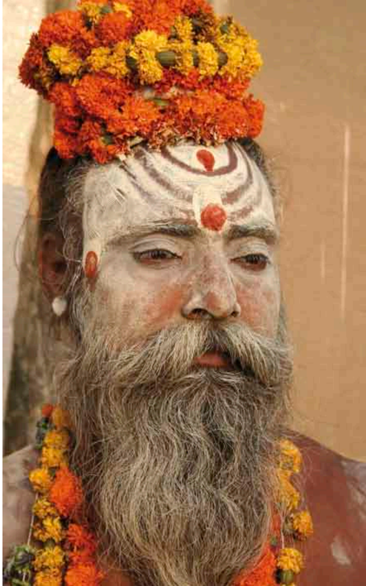
Vanarasi Sadhu con el rostro ornamentado y embadurnado con ceniza.