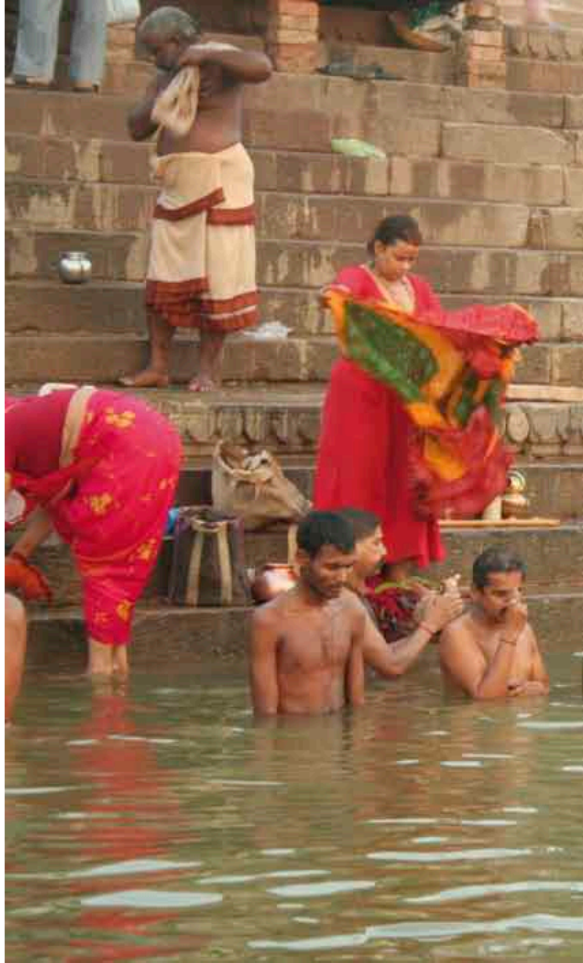
Varanasi Los fieles descienden a los ghat para sus abluciones antes de empezar la jornada de trabajo.