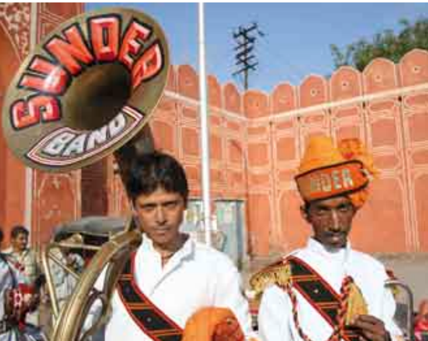
Músicos en Jaipur.